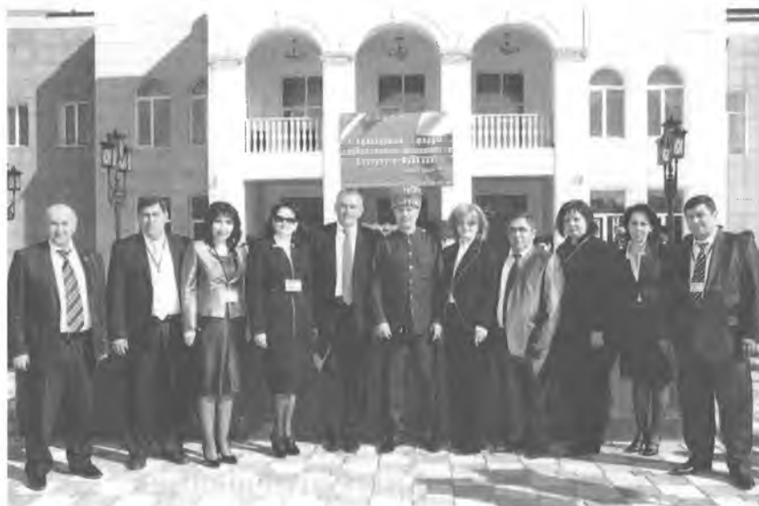
Участники научно-практической конференции «Государственная поддержка культуры малочисленных народов Северного Кавказа как фактор укрепления межнациональных отношений»