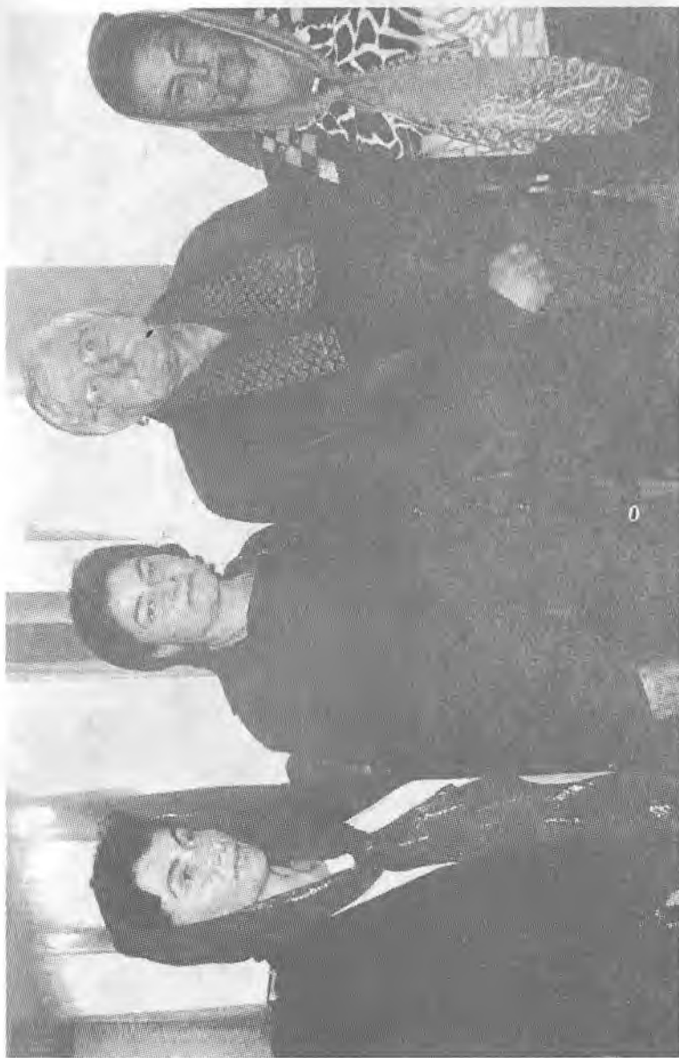
Известный чеченский ученый- фольклорист Шаарани Джамбеков в кругу дочерей писателя