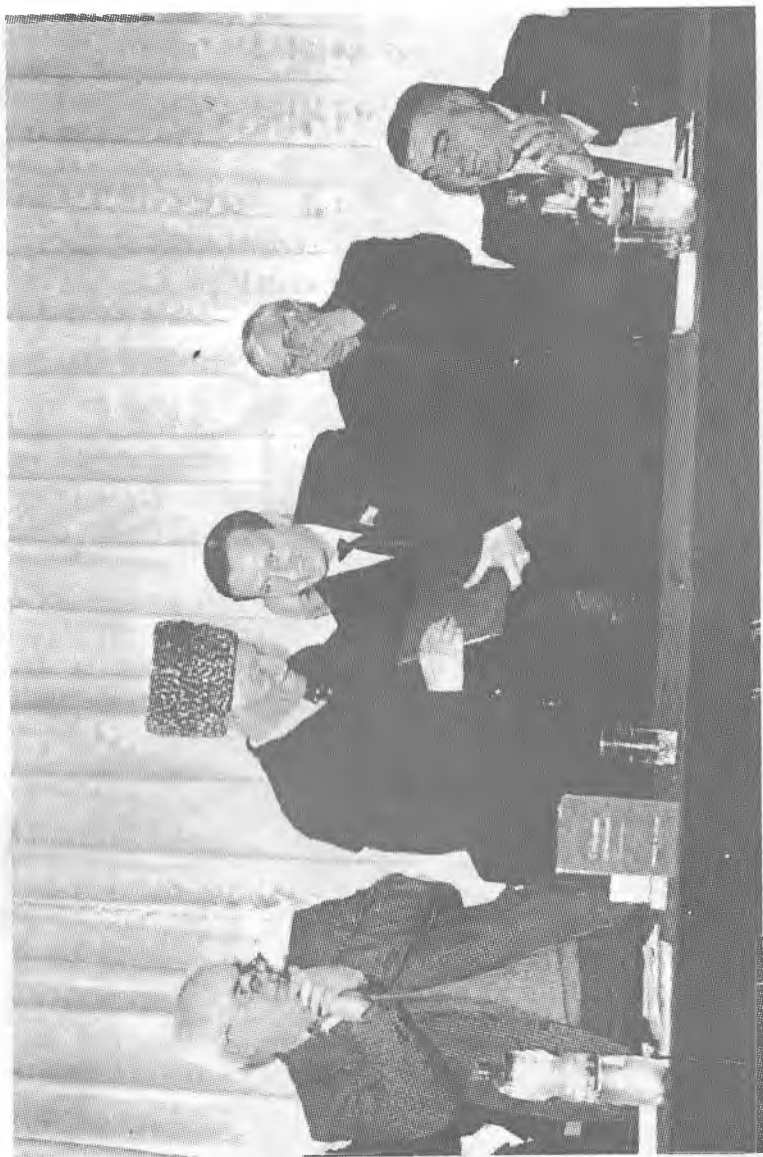
Председатель Госсовета ЧР Хусейн Исаев пришел на торжество писателя с поздравительным адресом