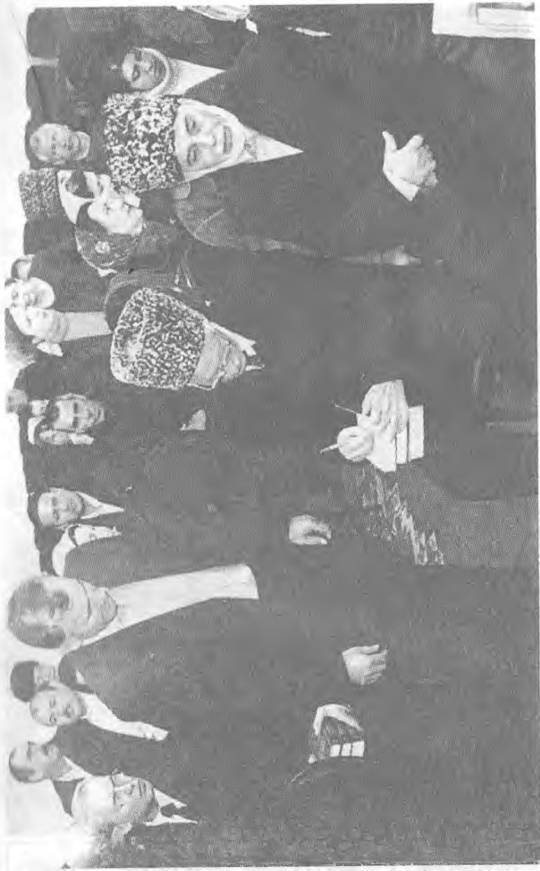
Автограф на память