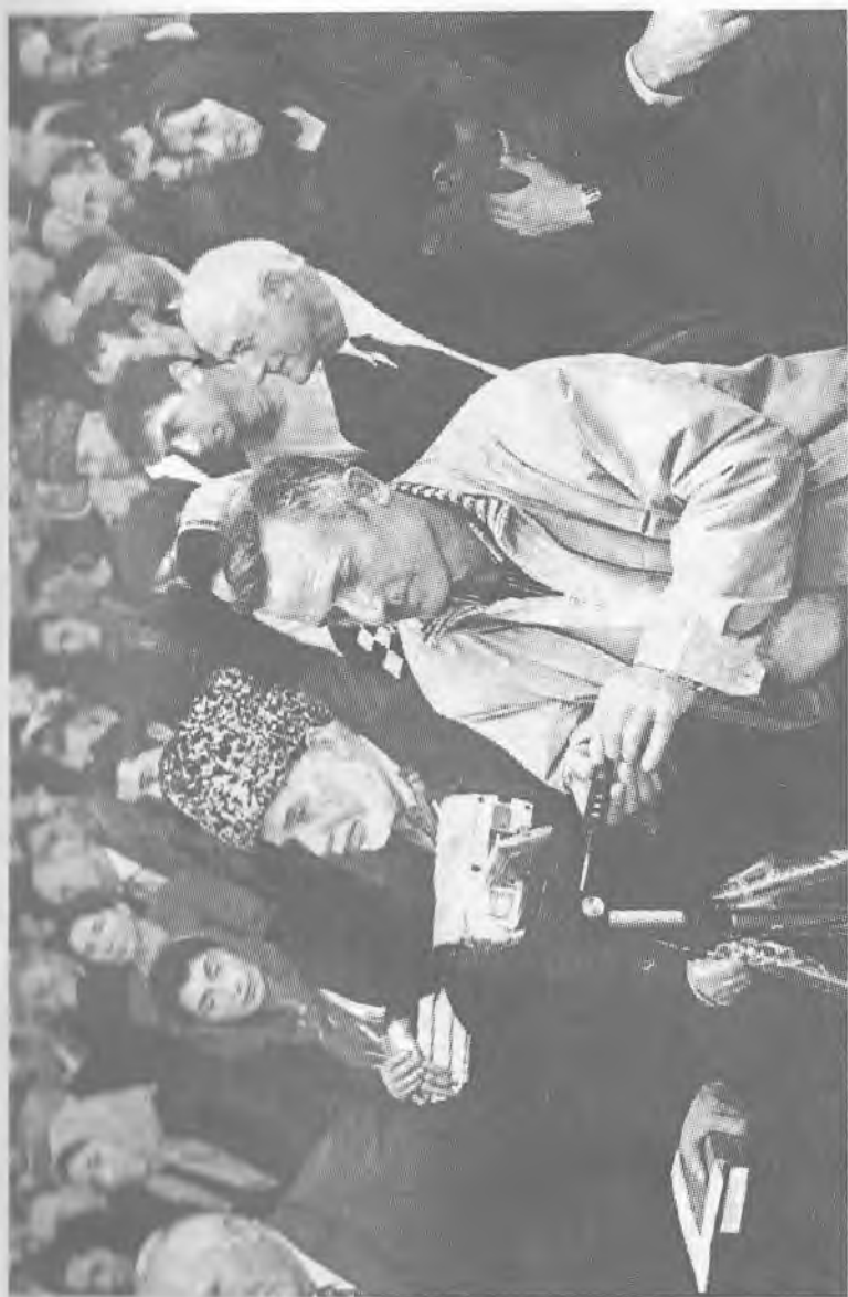
Аудитория внимлет слову писателя - классика