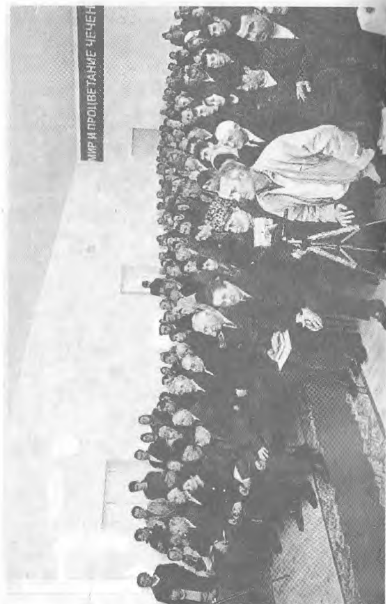
Таланты - в президиуме. Поклонники - в зале