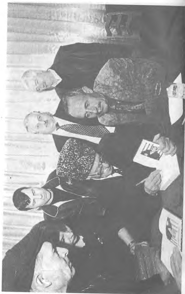
Очередь за автографом